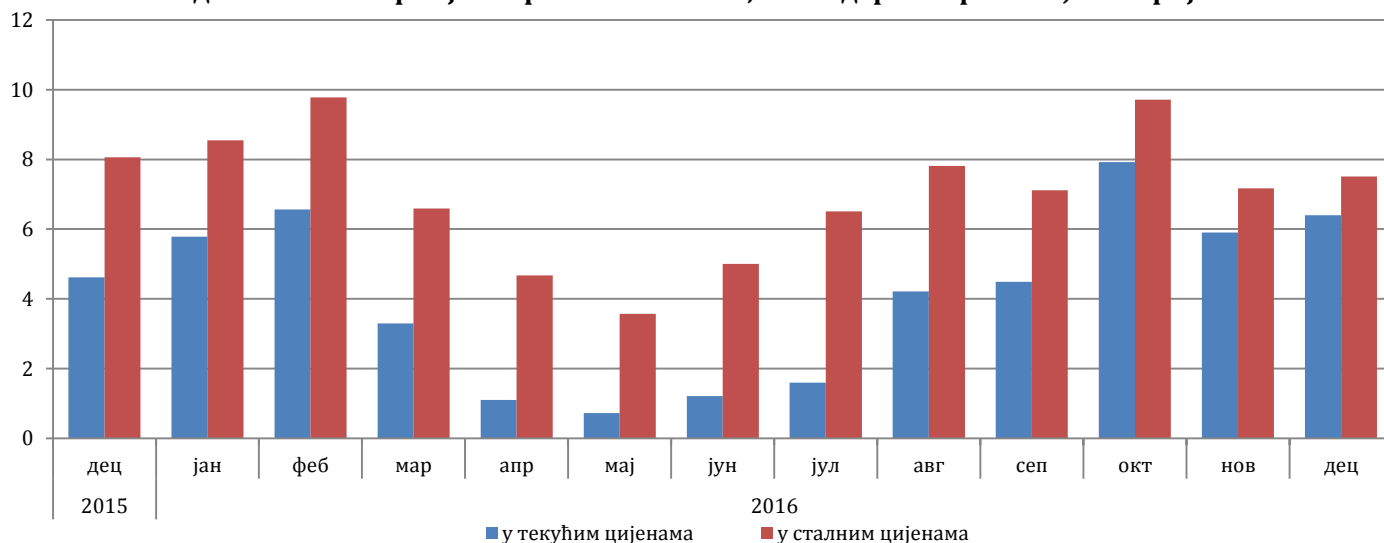
Годишње стопе промјене трговине на мало, календарски прилагођена серија БиХ

У односу на базну (2010.) годину, реални индекс промета прехранбеним производима забиљежио је раст од 16,6%, док је промет непрехрамбеним производима остварио раст од 72,2%. Промет од трговине на мало моторним горивима остварио је раст од 25,0%. Дати подаци су десезонирани.