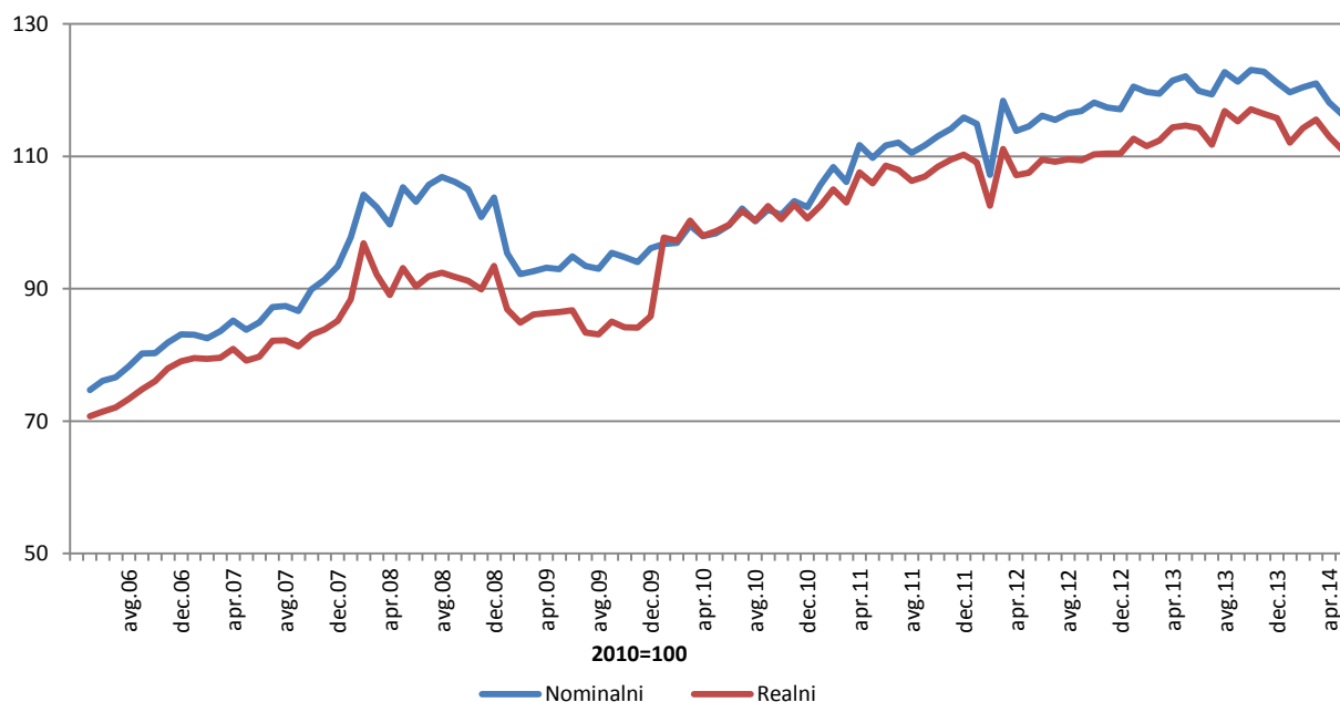
Indeksi prometa trgovine na malo, desezonirana serija BiH (2010=100)

Indeks prometa trgovine na malo u BiH u maju 2014. godine ostvario je nominalni rast od 16,3% dok je realni indeks veći za 10,9%, u odnosu na baznu (2010.) godinu. Dati podaci su desezonirani.