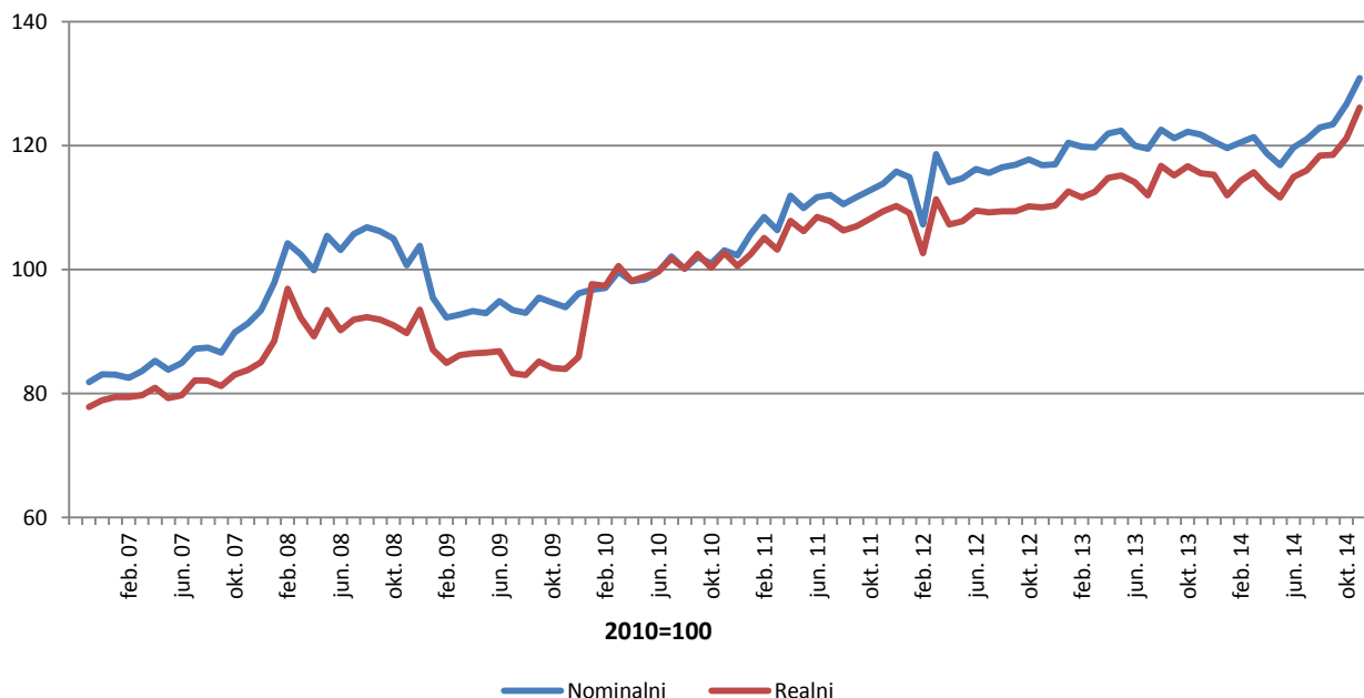
Indeksi prometa trgovine na malo, desezonirana serija BiH (2010=100)

Indeks prometa trgovine na malo u BiH u novembru 2014. godine ostvario je nominalni rast od 30,9 % dok je realni indeks veći za 26,1%, u odnosu na bazu (2010.) godinu. Dati podaci su desezonirani.