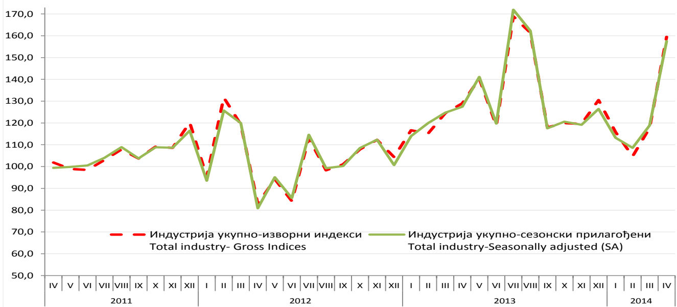
Серија индустрија укупно-изворни и сезонски прилагођени: април 2011- април 2014 (2010 = 100) Series for total industry - Gross and Seasonally Adjusted: April 2011 - April 2014 (2010=100)

Main Industrial Groups: In the period of January - April 2014, compared to the same period of 2013, production of Capital goods increased by 86.3%, Intermediate goods increased by 20.8%, Consumer durables increased by 20.0%, while Energy decreased by 10.4%, and Consumer non-durables decreased by 35.0%.