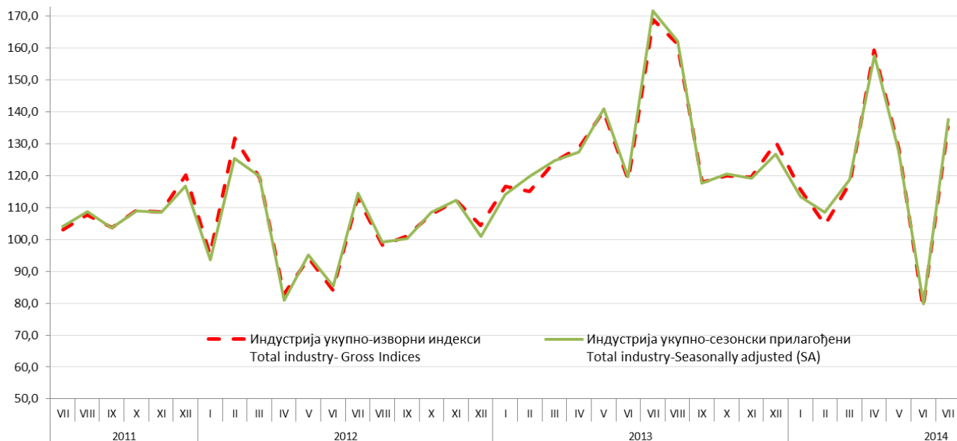
Серија индустрија укупно - изворни и сезонски прилагођени: јули 2011 - јули 2014(2010= 100) Series for total industry - Gross and Seasonally Adjusted: July 2011 - July 2014 (2010=100)

Main Industrial Groups: In the period of January - July 2014, compared to the same period of 2013, production of Capital goods increased by 119.6%, Consumer durables increased by 11.3%, while Energy decreased by 6.6%, Intermediate goods decreased by 16.1%, and Consumer non-durables decreased by 28.0%.