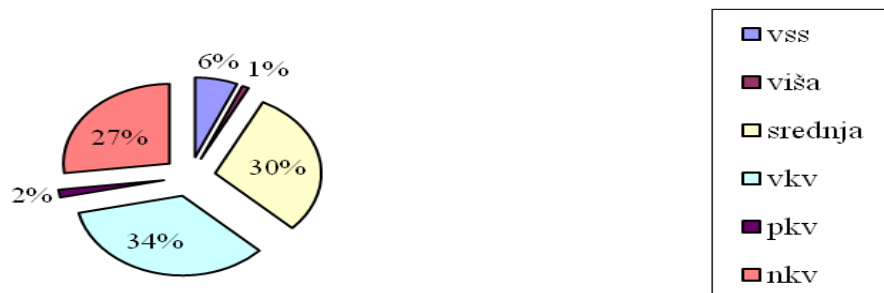
NEZAPOSLENI PREMA STRUČNOJ SPREMI APRIL 2013.