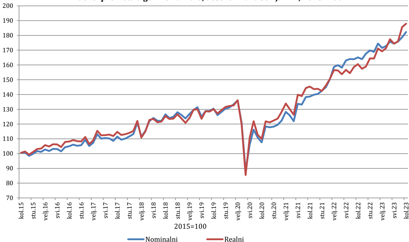
Indeksi prometa trgovine na malo, desezonirana serija BiH, 2015=100