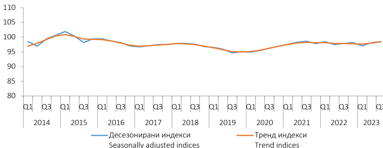
Графикон 1. Индекси производње у грађевинарству у БИХ, I Q 2014. -III Q 2023. Graph 1. Indices of production in construction in BiH, I Q 2014 - III Q 2023