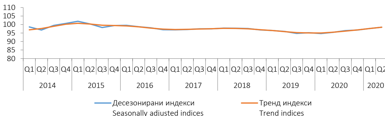
Графикон 1. Индекси производње у грађевинарству у БИХ, I Q 2014. - II Q 2021. Graph 1. Indices of production in construction in BiH, I Q 2014 - II Q 2021

Индекси, \emptyset 2015=100 Indices, \emptyset 2015=100