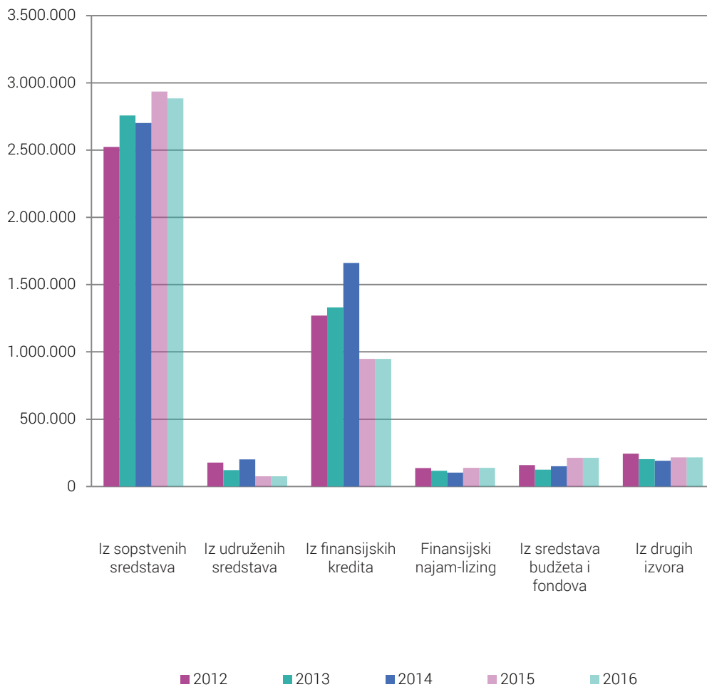
Ostvarene investicije u nova stalna sredstva u 2012-2016. godini, u hiljadama KM