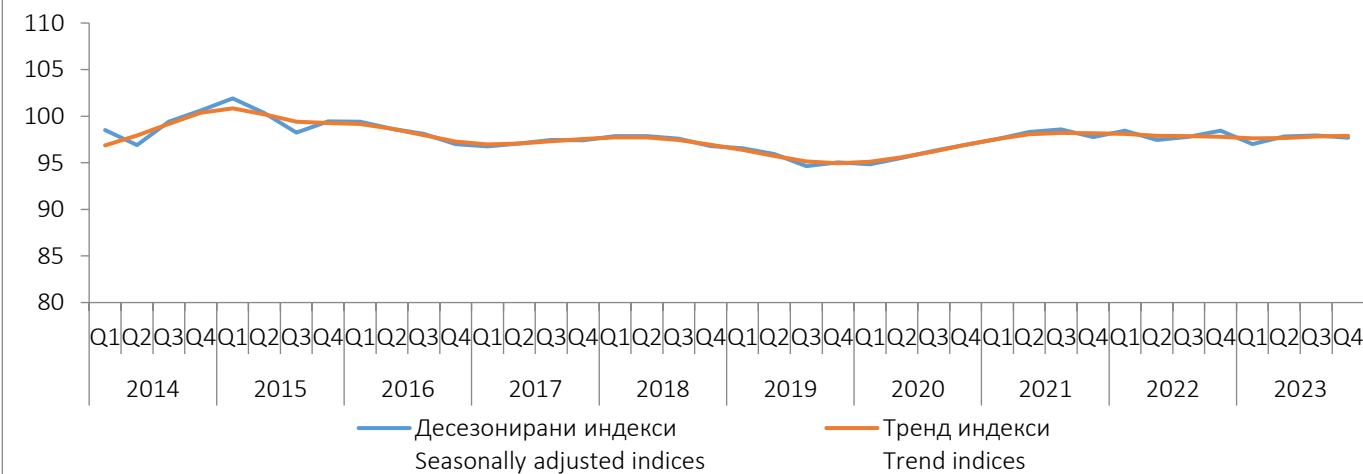
Графикон 1. Индекси производње у грађевинарству у БИХ, I Q 2014. -IV Q 2023. Graph 1. Indices of production in construction in BiH, I Q 2014 - IV Q 2023

Индекси, \emptyset 2015=100 Indices, \emptyset 2015=100