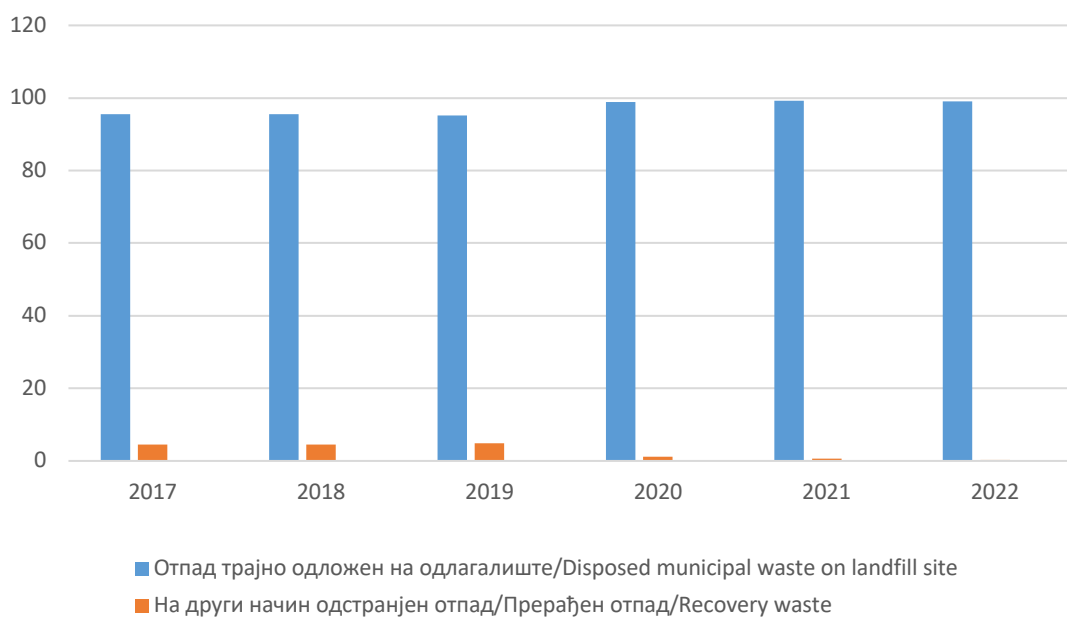
Графикон 2. УПРАВЉАЊЕ СКУПЉЕНИМ КОМУНАЛНИМ ОТПАДОМ, БиХ, % Graph 2. Collected municipal solid waste management, BiH; %

2 Опасни отпад је укључен. Includes hazardous waste