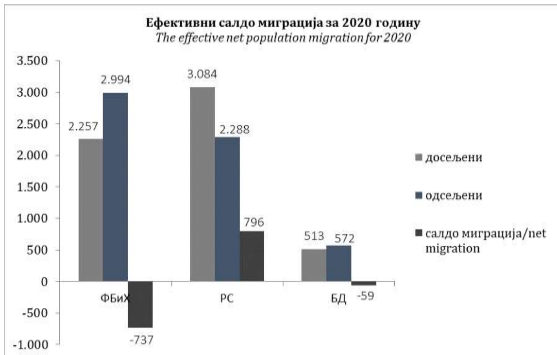
Графикон 3 Graph 3