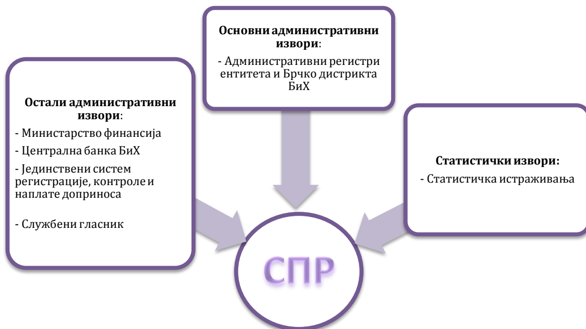
Слика 2. Извори података за Статистички пословни регистар