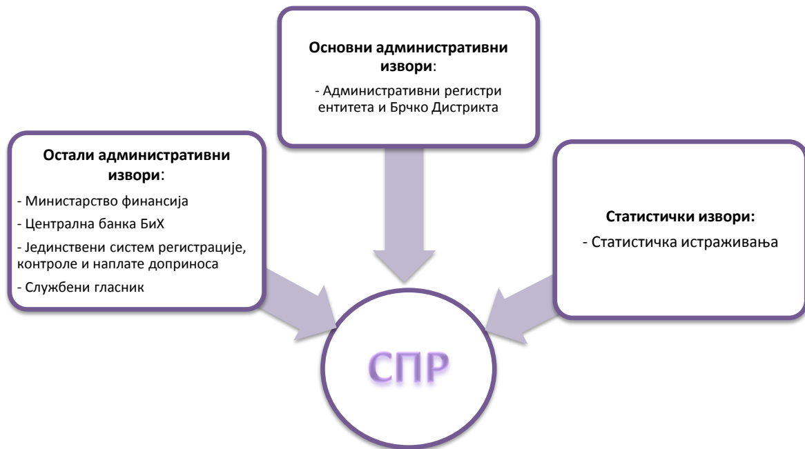
Слика 1. Извори података за Статистички пословни регистар

Извори података који се користе за ажурирање СПР-а, приказани су на Слици 1.