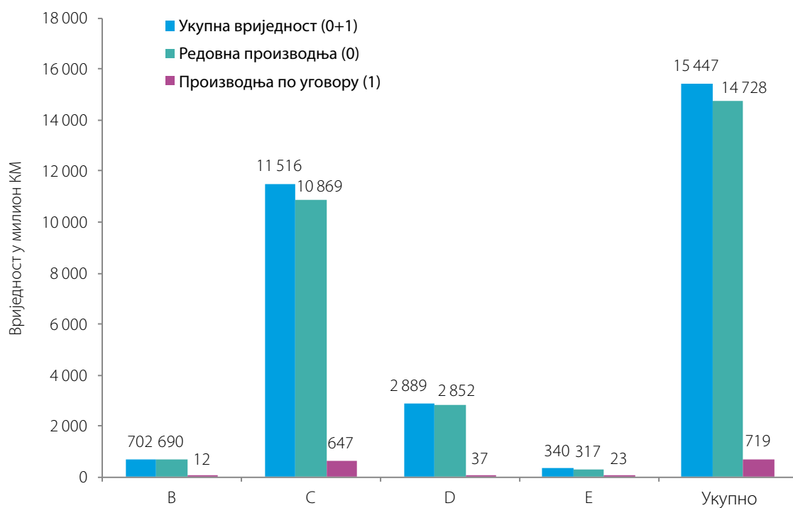
Графикон 2. Структура вриједности продаје/испоруке индустријских производа у 2020. по врсти производње и подручјима дјелатности